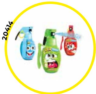
FIGURA GRANADAS SPRAY 50ML*15U/ -AGRUCONF-