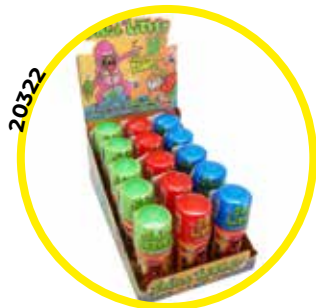
FIGURA SNOT LICKER ROLLER 40G*15U/ -AGRUCONF-