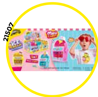
FIGURA MAQUINA DE HELADO 12U/-DISCO-