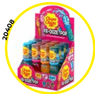
FIGURA CHUPA FROOZE POP 12U /-C.CHUPS-