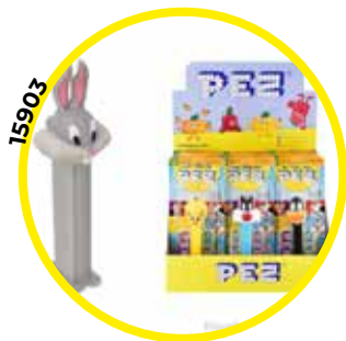
FIGURA MUÑECOS PEZ +2RECAR- GAS LOONEY TUNES 12U/