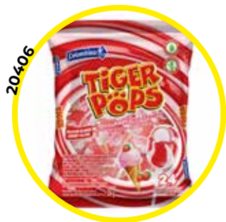
FIGURA TIGER POPS HELADO FRE- SA 24*1U/-FIESTA-