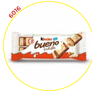
6016 FERRERO IBERICA SA CHOCOLATINA KINDER BUENO WHITE T/30 - FERRERO