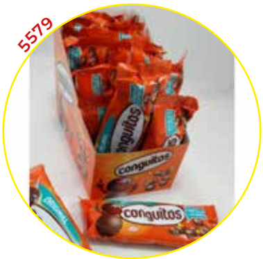
COMERCIAL CHOCOLATES LACASA SA GRAGEAS ESTUCHE