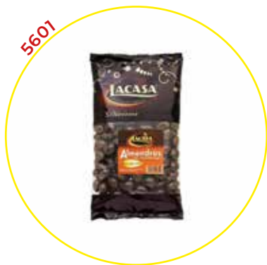
COMERCIAL CHOCOLATES LACASA SA GRAGEAS GRANEL