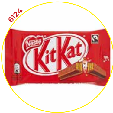
6124 NESTLE CHOCOLATINA KIT KAT 45GRS.*36U/ -NESTLE-