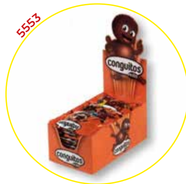
COMERCIAL CHOCOLATES LACASA SA GRAGEAS ESTUCHE