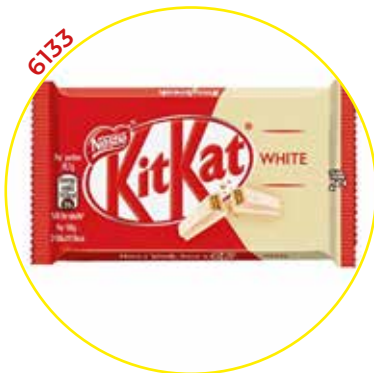
6133 NESTLE CHOCOLATINA KIT KAT BLANCO 41,5g*24U/ -NESTLE -