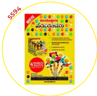
COMERCIAL CHOCOLATES LACASA SA GRAGEAS ESTUCHE