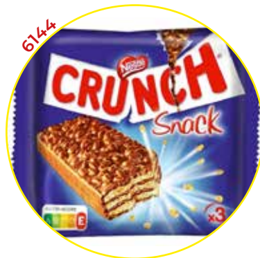
6144 NESTLE CHOCOLATINA SNACK CRUNCH 30 GR. * 30 U. - NESTLE -