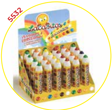
COMERCIAL CHOCOLATES LACASA SA GRAGEAS ESTUCHE