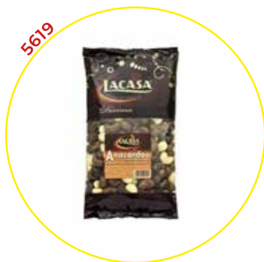
COMERCIAL CHOCOLATES LACASA SA GRAGEAS GRANEL