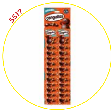
COMERCIAL CHOCOLATES LACASA SA GRAGEAS ESTUCHE