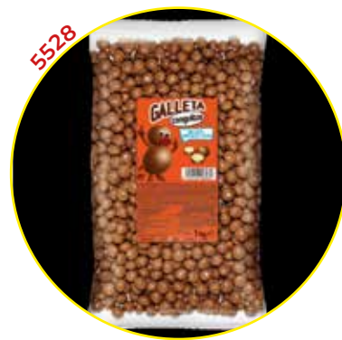
COMERCIAL CHOCOLATES LACASA SA GRAGEAS GRANEL