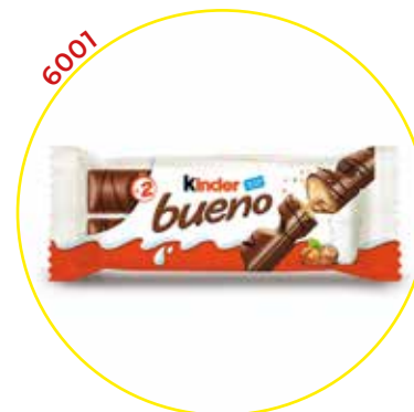
6001 FERRERO IBERICA SA CHOCOLATINA KINDER BUENO T/30 - FERRE- RO