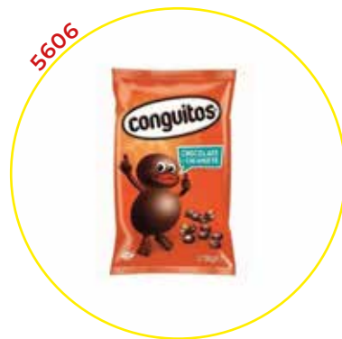
COMERCIAL CHOCOLATES LACASA SA GRAGEAS GRANEL

ALMENDRA CALIF. CHOCO LECHE 1KG.-LACASA-