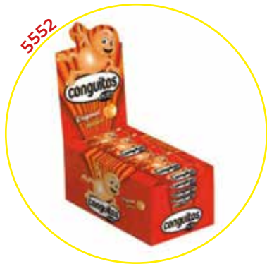
COMERCIAL CHOCOLATES LACASA SA GRAGEAS ESTUCHE

CONGUITOS BLANCOS 45G 16U/ (BTAS)-LACASA