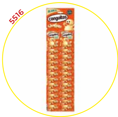
COMERCIAL CHOCOLATES LACASA SA GRAGEAS ESTUCHE