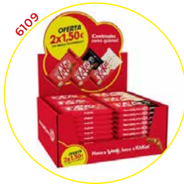
6109 NESTLE CHOCOLATINA EXP KIT KAT 2*1,50€ 60U/-NESTLE-