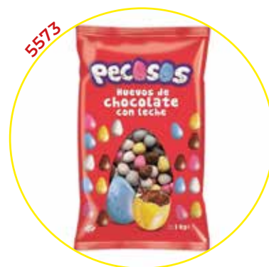
COMERCIAL CHOCOLATES LACASA SA GRAGEAS GRANEL