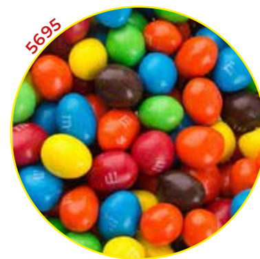
MARS MULTISALTES SPAIN SL GRAGEAS GRANEL