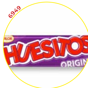
6949 VALOR CHOCOLATINA HUESITOS ORIGINAL 20g 48U