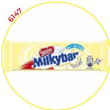
6147 NESTLE CHOCOLATINA MILKIBAR 25G 18U/-NESTLE