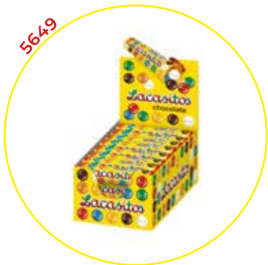
COMERCIAL CHOCOLATES LACASA SA GRAGEAS ESTUCHE