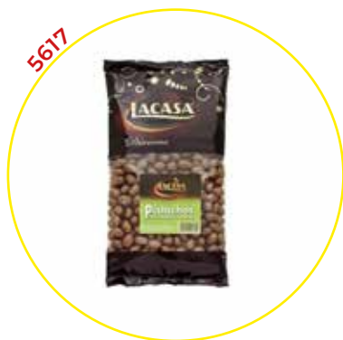
COMERCIAL CHOCOLATES LACASA SA GRAGEAS GRANEL