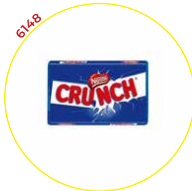
6148 NESTLE CHOCOLATINA CRUNCH 40GR 15U/ -NESTLE-