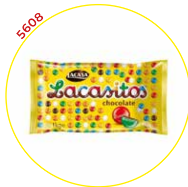
COMERCIAL CHOCOLATES LACASA SA GRAGEAS GRANEL