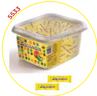
COMERCIAL CHOCOLATES LACASA SA GRAGEAS ESTUCHE