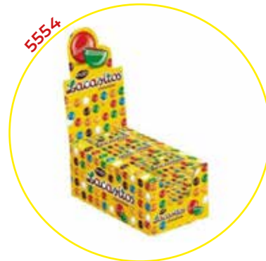
COMERCIAL CHOCOLATES LACASA SA GRAGEAS ESTUCHE