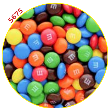
MARS MULTISALTES SPAIN SL GRAGEAS GRANEL

DADOS NARANJA (CHOCOLA- TE) 1KG.-LACASA-