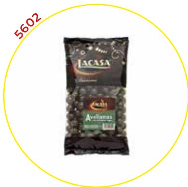
COMERCIAL CHOCOLATES LACASA SA GRAGEAS GRANEL