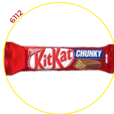
6112 NESTLE CHOCOLATINA KIT KAT CHUNKY 40g*24U/ -NESTLE -