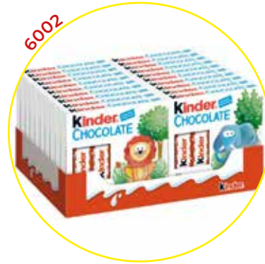
6002 FERRERO IBERICA SA CHOCOLATINA KINDER CHOCO 4 * 20 - FE- RRERO