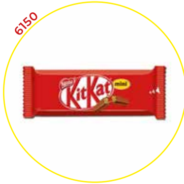
6150 NESTLE CHOCOLATINA KIT KAT MINI 36u/ APRO- X.600g-NESTLE-