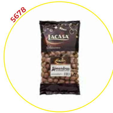
COMERCIAL CHOCOLATES LACASA SA GRAGEAS GRANEL

ALMENDRA CALIF. CHOCO LECHE 1KG.-LACASA-