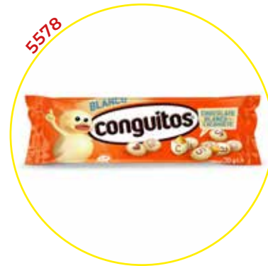
COMERCIAL CHOCOLATES LACASA SA GRAGEAS ESTUCHE

CONGUITOS BLANCOS 45G 16U/ (BTAS)-LACASA