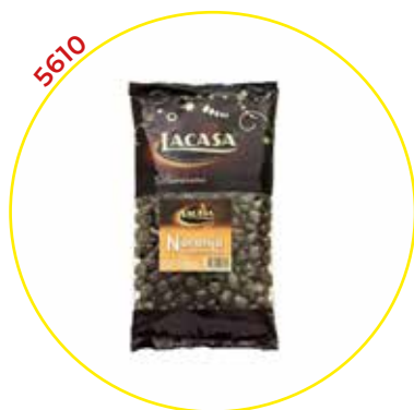
COMERCIAL CHOCOLATES LACASA SA GRAGEAS GRANEL

DADOS NARANJA (CHOCOLA- TE) 1KG.-LACASA-