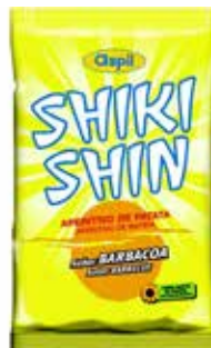
EXTRUSIONADOS SHIKI-SHIN 85 GRS. 12U/-AS- PIL-