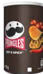
PATATAS PRINGLES HOT & SPICY 70 GRS 12U.-KELLOGG