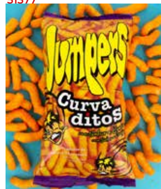
EXTRUSIONADOS CURVADITOS 100G 8U PVP 1€/-SYCH-