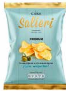
PATATAS PATATA PREMIUM 55GR*20U/ -SALIERI-