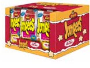
EXTRUSIONADOS JUMPERS YORK QUESO 60G*18U/ CAJA -SYC-