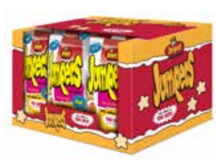
EXTRUSIONADOS JUMPERS YORK QUESO 42G*24U 50CTS -SYC-