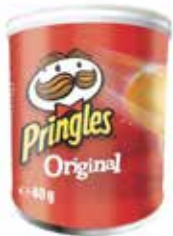
PATATAS PRINGLES PEQUEÑA ORIGI- NAL 40G*12U/ -KELL