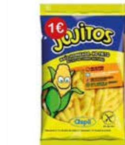
EXTRUSIONADOS JOJITO 85 GRS 8U PVP 1€ -ASPIL-