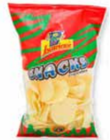
PATATAS PATATA CHIC FAMILIAR 100G*15U/-ISCARIENS