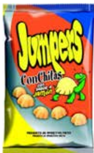
EXTRUSIONADOS CONCHITAS JAMON 30G*30U/ -SYCH-