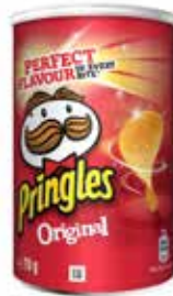
PATATAS PRINGLES ORIGINAL 70 GRS 12U.-KELLOGG