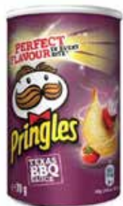
PATATAS PRINGLES BARBACOA 70 GRS 12U.-KELLOGG