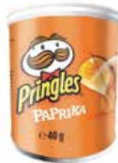
PATATAS PRINGLES PEQUEÑA PA- PRIKA 40G*12U/ KELLOG