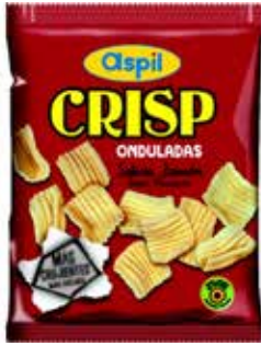
PATATAS CRISP 17 GRS.* 35 U./-ASPIL-