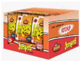
EXTRUSIONADOS JUMPERS KETCHUP 42G*24U 50CTS -SYC-