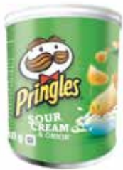
PATATAS PRINGLES PEQUEÑA CREAM&ONION 40G*12U/K