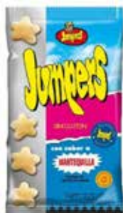
EXTRUSIONADOS JUMPERS MANTEQUILLA 90G 12U/ -SYCH-