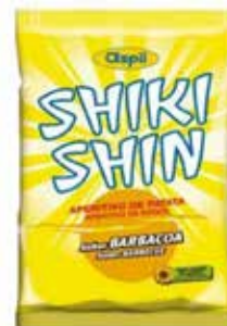
EXTRUSIONADOS SHIKI SHIN BARBACOA 20g*30U/-ASPIL-