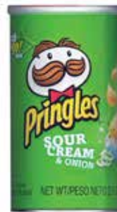
PATATAS PRINGLES CREAM&ONION 70 GRS 12U.-KELL