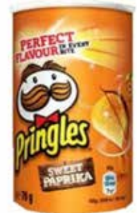
PATATAS PRINGLES PAPRIKA 70 GRS 12U.-KELLOGG