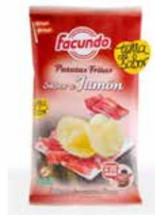
PATATAS PATATA FRITA JAMON 12U/*55G -FACUNDO-