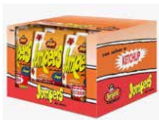
EXTRUSIONADOS JUMPERS KETCHUP 60G*18U/ CAJA -SYC-