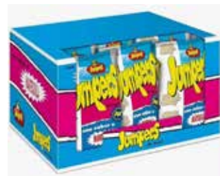
EXTRUSIONADOS JUMPERS VENDING MAN- TEQUILLA 26GRS. 75U/-