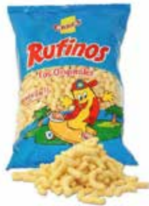
EXTRUSIONADOS RUFINOS GRANDE 20U*80G -CRECS-