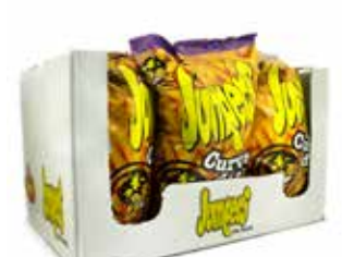
EXTRUSIONADOS CURVADITOS 100G 8U/- SYCH-