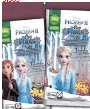
EXTRUSIONADOS JUMPERS MANTEQUILLA 42G*24U 50CTS -SYC-