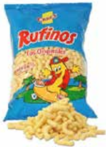
EXTRUSIONADOS RUFINOS PEQUEÑO 26U*28G -CRECS-